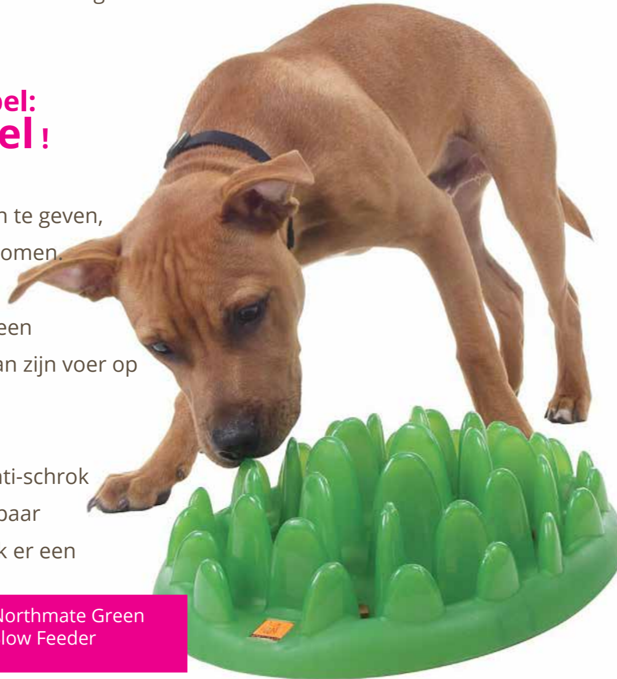
Northmate Green Slow Feeder