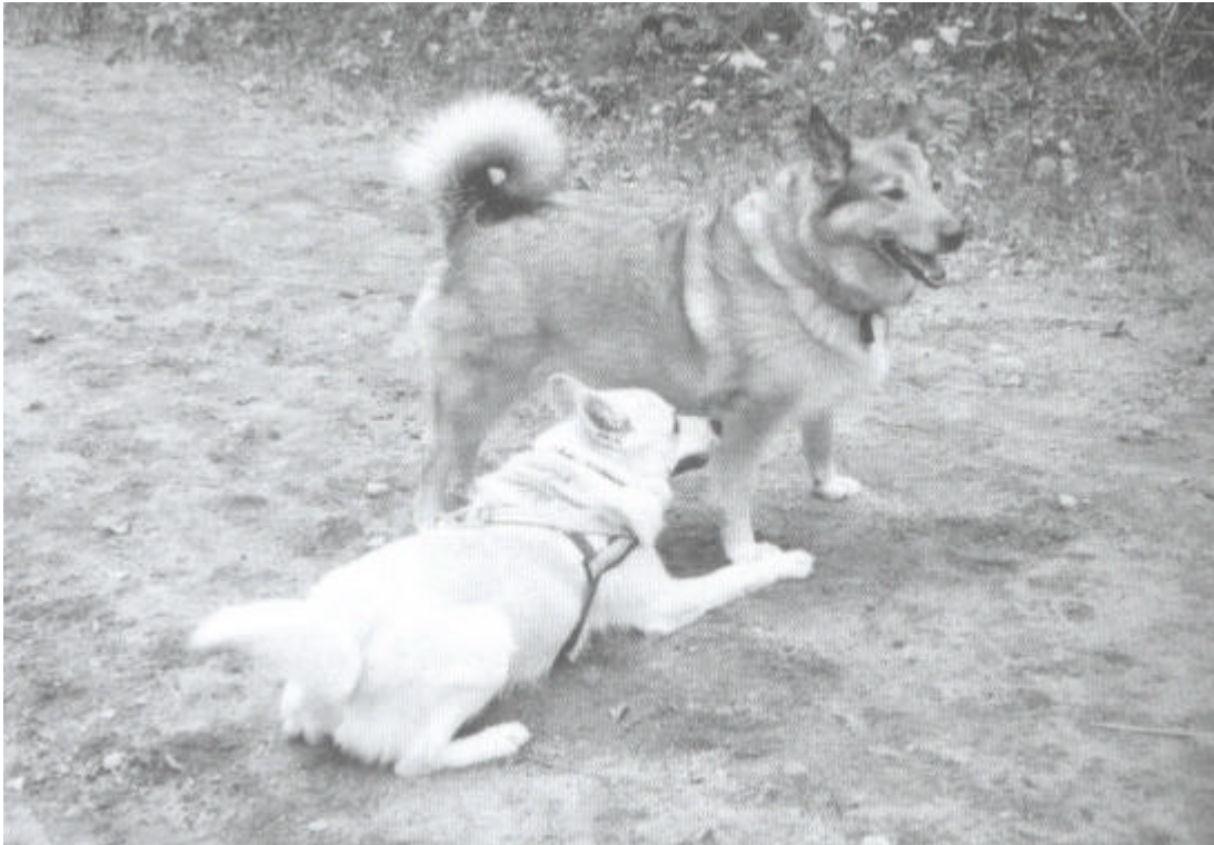
Een combinatie van kalmerende signalen.

De vrijwilliger liep op de hond en eigenaar af, en op het moment dat de hond haar opmerkte, ging ze langzamer lopen en liep in een fraaie bocht van hen vandaan, terwijl ze wegkeek. De hond had zich ondertussen achter de eigenaar verstopt. De vrijwilliger stopte een paar meter zijwaarts van hen vandaan, ging rustig op haar hurken zitten, krabbelde wat aan het gras en zorgde er verder voor volkomen rustig te zijn. Na enkele seconden kwam de hond voorzichtig te voorschijn, naderde de vrijwilliger en maakte contact.