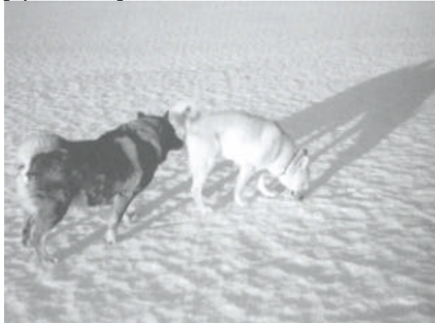
Snuffelen om de tegenpartij te kalmeren.

Je bent uit met je hond en er komt een hond met eigenaar recht op je af. Je hond zal in deze situatie misschien een beetje wegstaren van degene die komt en in de berm snuffelen tot de ander voorbij is.