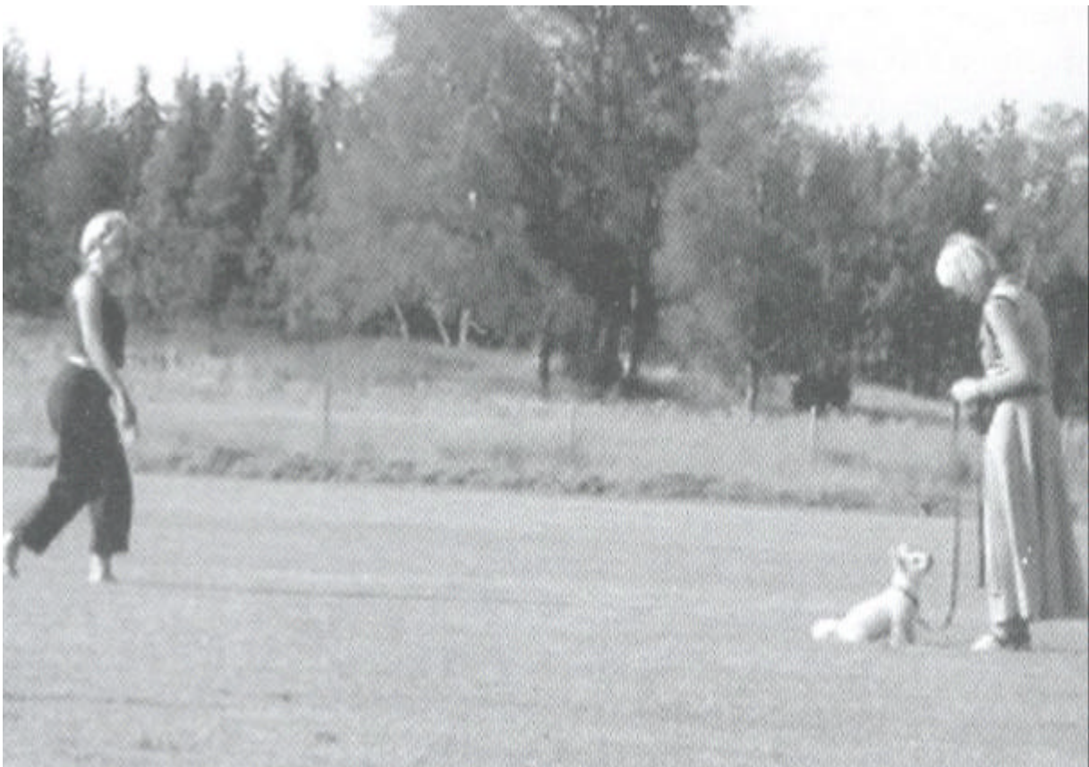
Nader een angstige hond in een grote boog.

We kunnen onze honden leren om bijna recht langs andere honden te gaan, maar daar is een heel proces voor nodig. Eerst leren we de hond zo'n grote bocht maken dat hij zich nog goed voelt. We letten daarbij goed op dat hij zich gedraagt zoals het hoort in de taal van de honden. Daarna kunnen we de bocht steeds kleiner maken tot de hond het prima aankan om bijna recht langs een andere hond te lopen. Misschien buigt hij zich nog symbolisch van de andere hond af en kijkt weg.