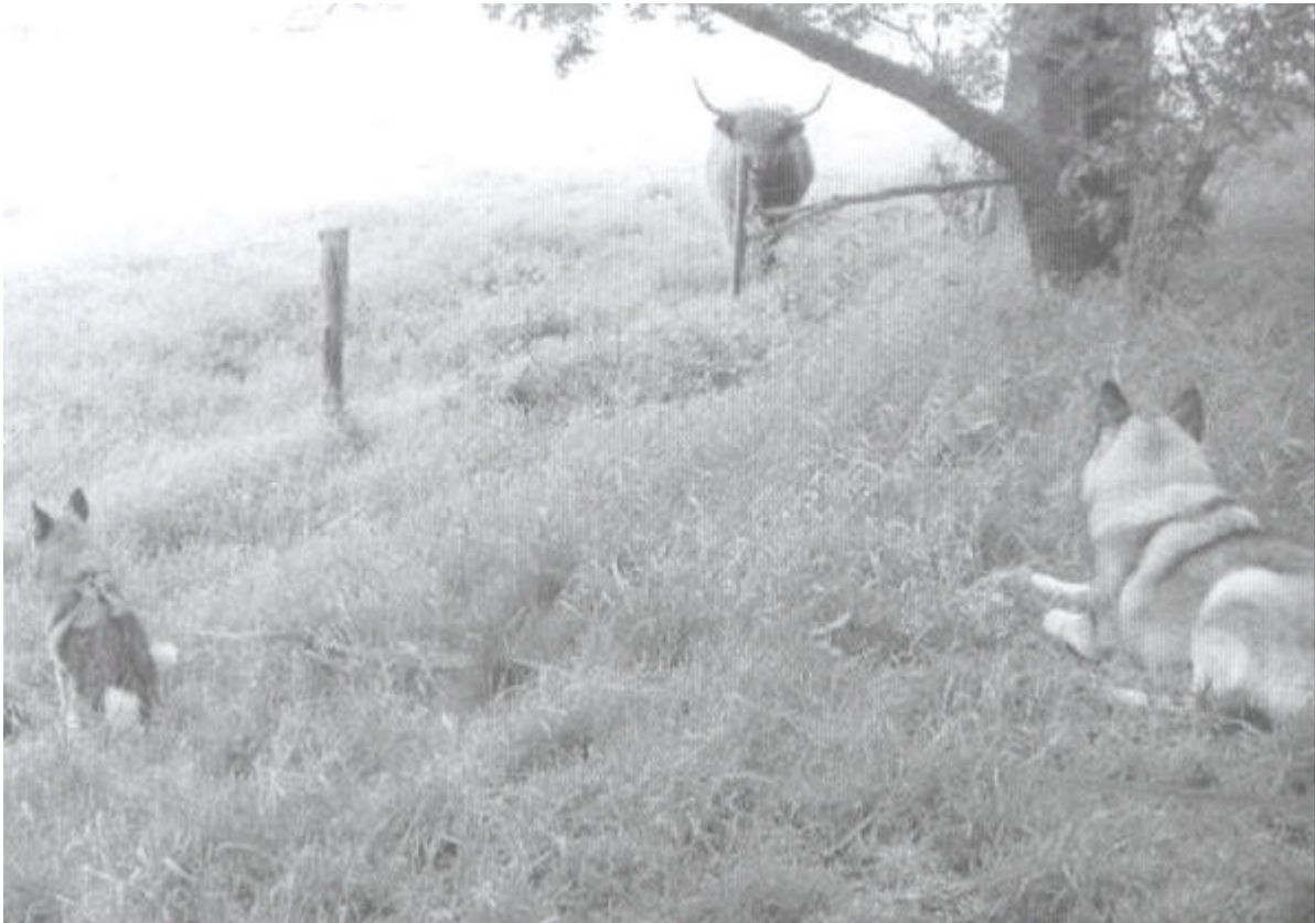
Honden gebruiken kalmerende signalen ook om zichzelf te kalmeren. Hier het gaan zitten en wegstaren.

Een enorme Malamut-rue kwam een kleine Terriërpup tegen op zijn wandeling. Beide waren aangelijnd, maar de pup vond de grote hond raar en vertoonde alle tekenen van angst. De Malamut ging met zijn rug naar de pup toe zitten. Hij bleef rustig zitten en wierp af en toe een blik over zijn schouder. Uiteindelijk ging de pup naar hem toe om aan zijn achterkant te snuffelen.