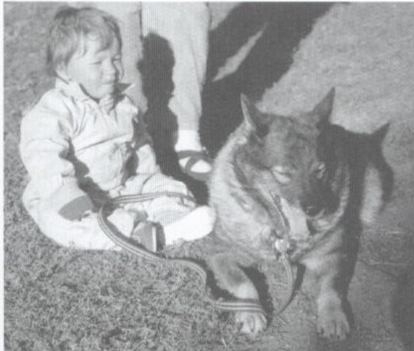
De gapende hond geeft aan dat hij zich niet zeker voelt met het kindje

Honden doen dat ook, maar ze gebruiken het gapen veel vaker om te kalmeren dan omdat ze moe zijn. Je zult je hond zien gapen wanneer hij opgewonden is omdat hij uit mag. Je rommelt nog wat en trekt je jas aan, je hond blijft maar gapen.