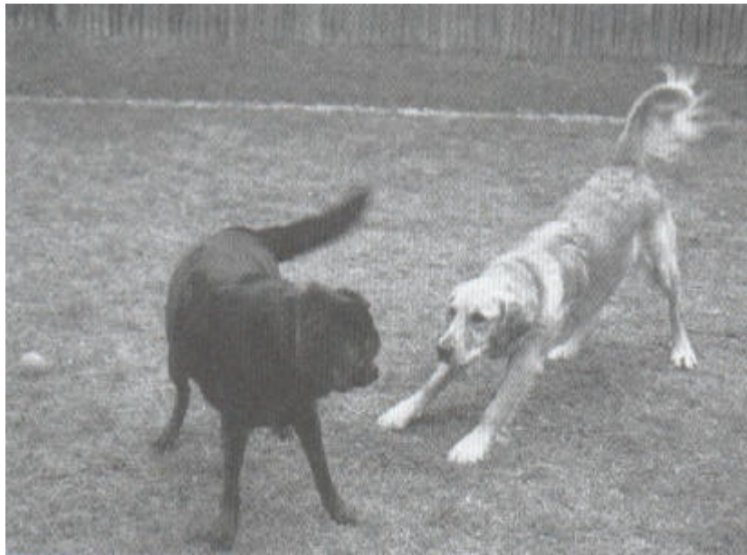
Honden proberen in principe conflicten te vermijden door elkaar signalen te geven, zoals bevriezen of het aannemen van de speelhouding.

Buiten wil de hond naar iets spannends toe en je trekt en rukt hem daar vandaan. De hond antwoordt met kalmerende signalen om je wat aardiger te maken.