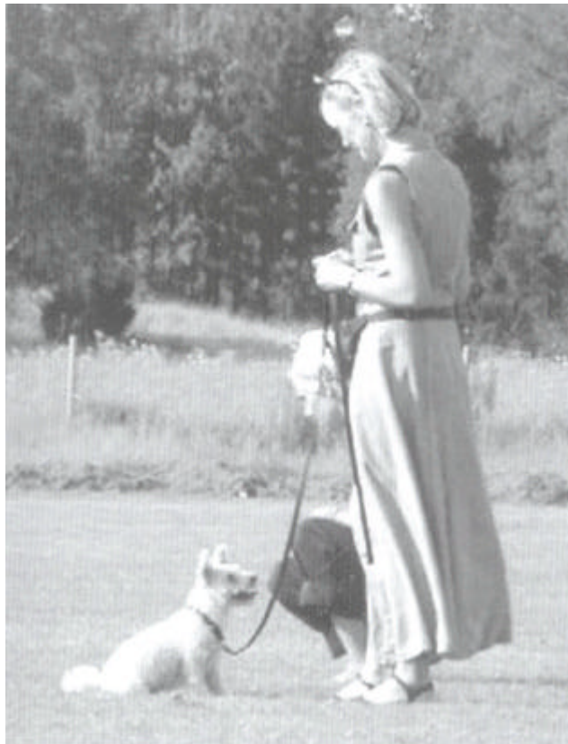
En blijf wegkijken tot de hond zelf contact maakt.

In zulke situaties helpt gehoorzaamheid helemaal niets. We kunnen de hond het commando volgen en dat zal hij wellicht ook doen, maar hij voelt zich daarbij helemaal niet veel beter. Hij doet iets tegen zijn instinct in, en instinct is sterk bij een hond.