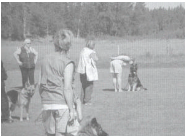
Kijk eens wat er gebeurt wanneer je je over je hond heen buigt

In de loop van korte tijd zul je ontdekken dat je de honden die je ziet leest. Het wordt een soort hobby, en je kunt het gewoon niet meer laten. De meeste mensen raken verslaafd. En ik kan alleen maar zetten: welkom bij de club – welkom in de wereld van de hondentaal!