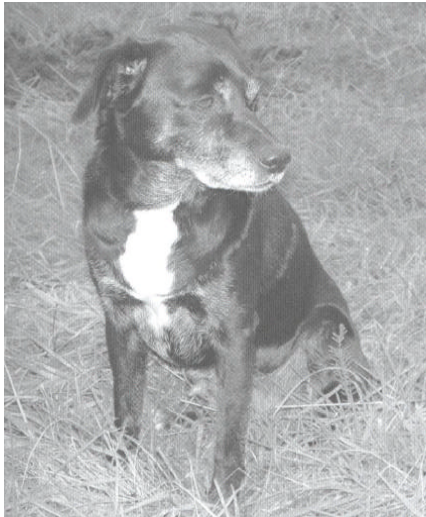
Overduidelijk en heel rustig wegstaren van de bedreigende camera.

Gedurende het trainen en omgaan met honden ontstaan veel misverstanden en onnodige problemen omdat de eigenaar niet begrijpt wat de hond doet wanneer hij 'bevriest'.