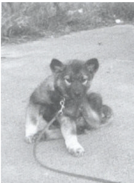
De stressvolle reis van de fokker naar het nieuwe huis.

Observeer je hond, merk op wanneer de kalmerende signalen gevertellen dat je hond gestresst begint te raken en help hem uit de situatie. Op tijd tussenbeide komen om deze ontwikkeling te stoppen is belangrijk.