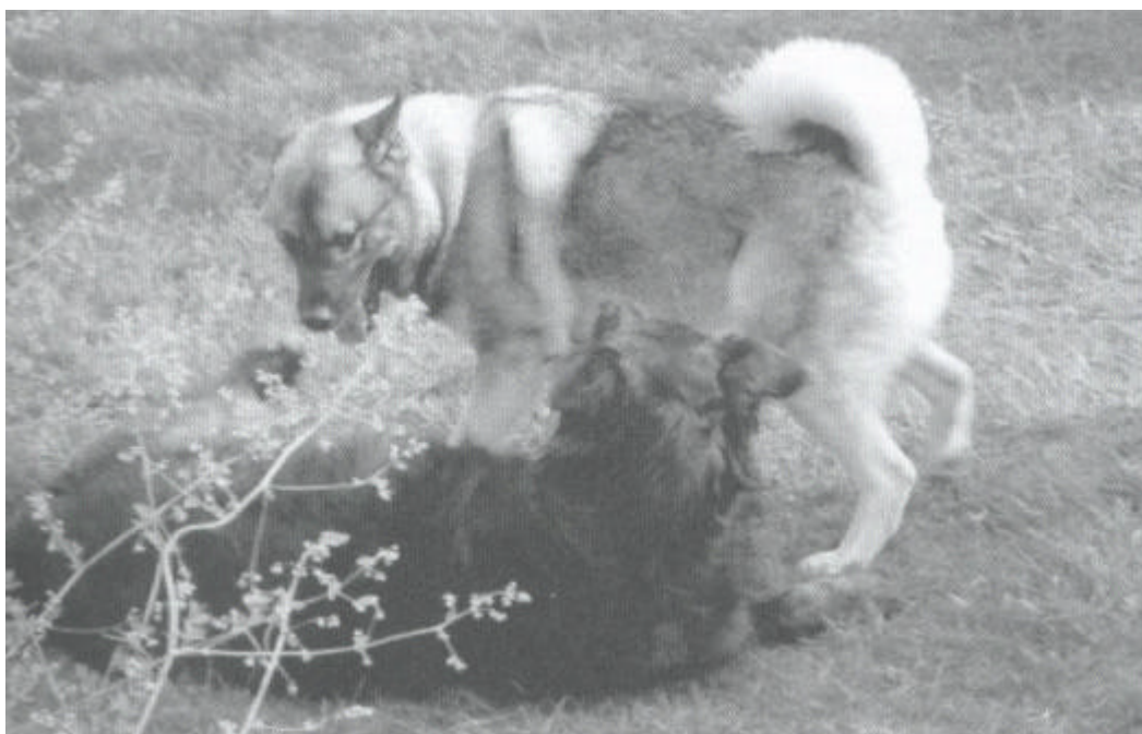
Nooit recht op elkaar af ...

De jonge Duitse staander teef was snel zeker van mij en van anderen die een vriendelijke procedure volgden en later functioneerde ze prima bij mensen. De oorzaak, zoals later bleek waren agressie en bestraffingen door de fokker, toen ze nog heel klein was. Ze had eenvoudigweg geleerd om bang te zijn voor mensen na alle bedreigingen en boosheid bij iedereen die haar naderde. Ze was gaan geloven dat iedereen die naar haar toe kwam kwaad in de zin had en haar iets wilde aandoen. Gelukkig is het mogelijk dergelijke gevoelens te veranderen.