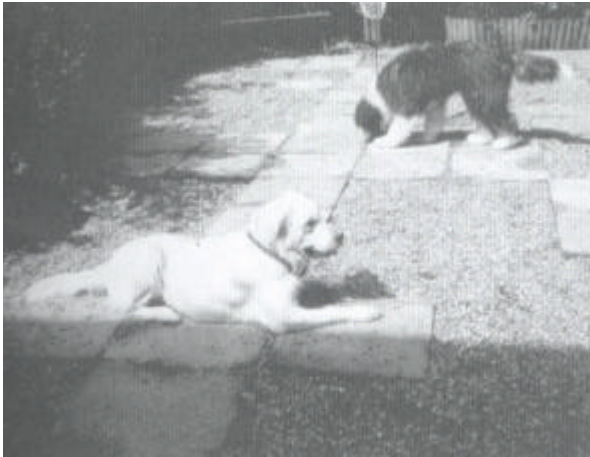
Gaan liggen, een krachtig signaal.

Hierover bestaan een aantal misverstanden. Gaan liggen en je buik tonen kan in sommige gevallen onderwerping genoemd worden.