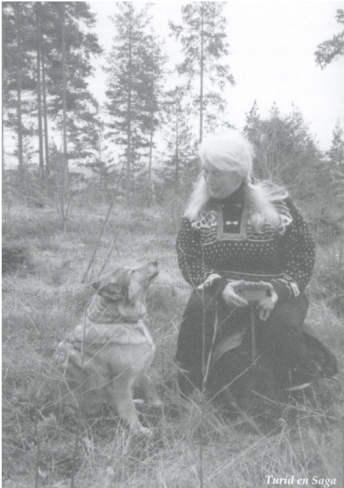
Turid en Saga

Welkom in de wereld van de hondentaal. Ik hoop dat je dezelfde ervaringen zult hebben die ik heb gehad en nog steeds heb. Jullie honden verdienen het!