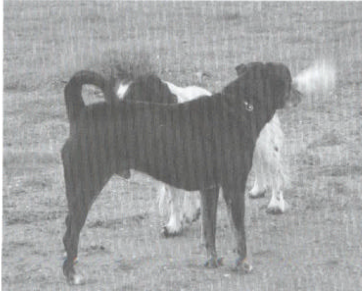
Honden die elkaar niet kennen, lopen zelden recht op elkaar af.

Onze honden hebben deze signalen geërfd. Alle honden over de hele wereld hebben de signalen, ongeacht ras, grootte, kleur of vorm. Het is een echt universele taal.