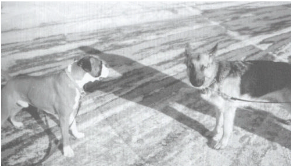
Een duidelijk voorbeeld van een hond die wegstijkt wanneer een andere hond nadert

Wanneer je de camera tevoorschijn haalt en een foto van je hond wil nemen, recht van voren, zul je bijna altijd een foto krijgen van een hond die naar de zijkant kijkt – de hond moet de camera kalmeren.