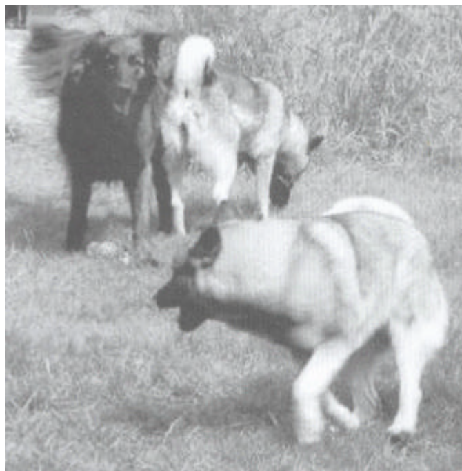
Twee wild spelende honden opgesplitst door een derde, die ook nog eens gaat staan snuffelen.

De meeste honden gebruiken snuffelen als een kalmerend signaal. Soms gaat de neus zo weinig naar beneden dat je het bijna niet registreert. In ieder geval niet als je je ogen niet op de hond gericht houdt. Soms is er echter ook geen twijfel mogelijk.