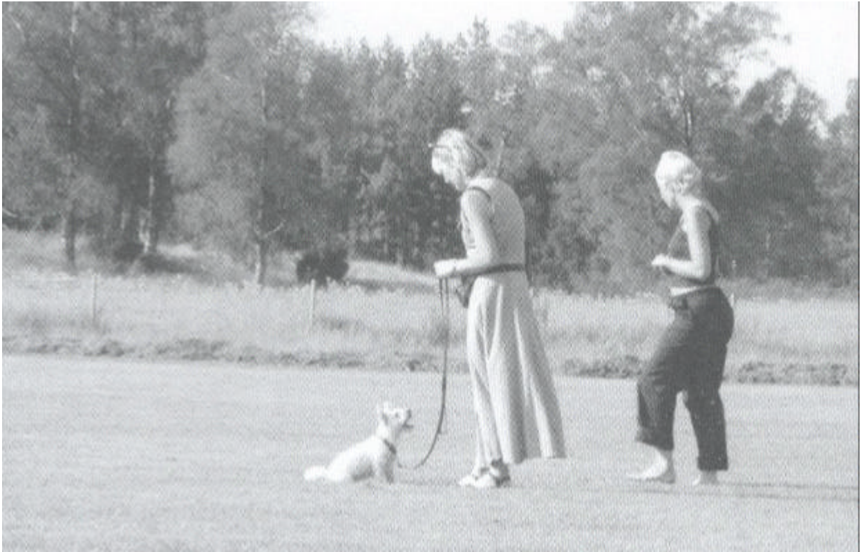
Wegkijken, ook als je dichterbij komt.